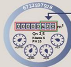
Zähler ohne Kommastellen

WICHTIG: ZÄHLERSTAND OHNE KOMMASTELLEN (ROTE ZAHLEN) ABLESEN!